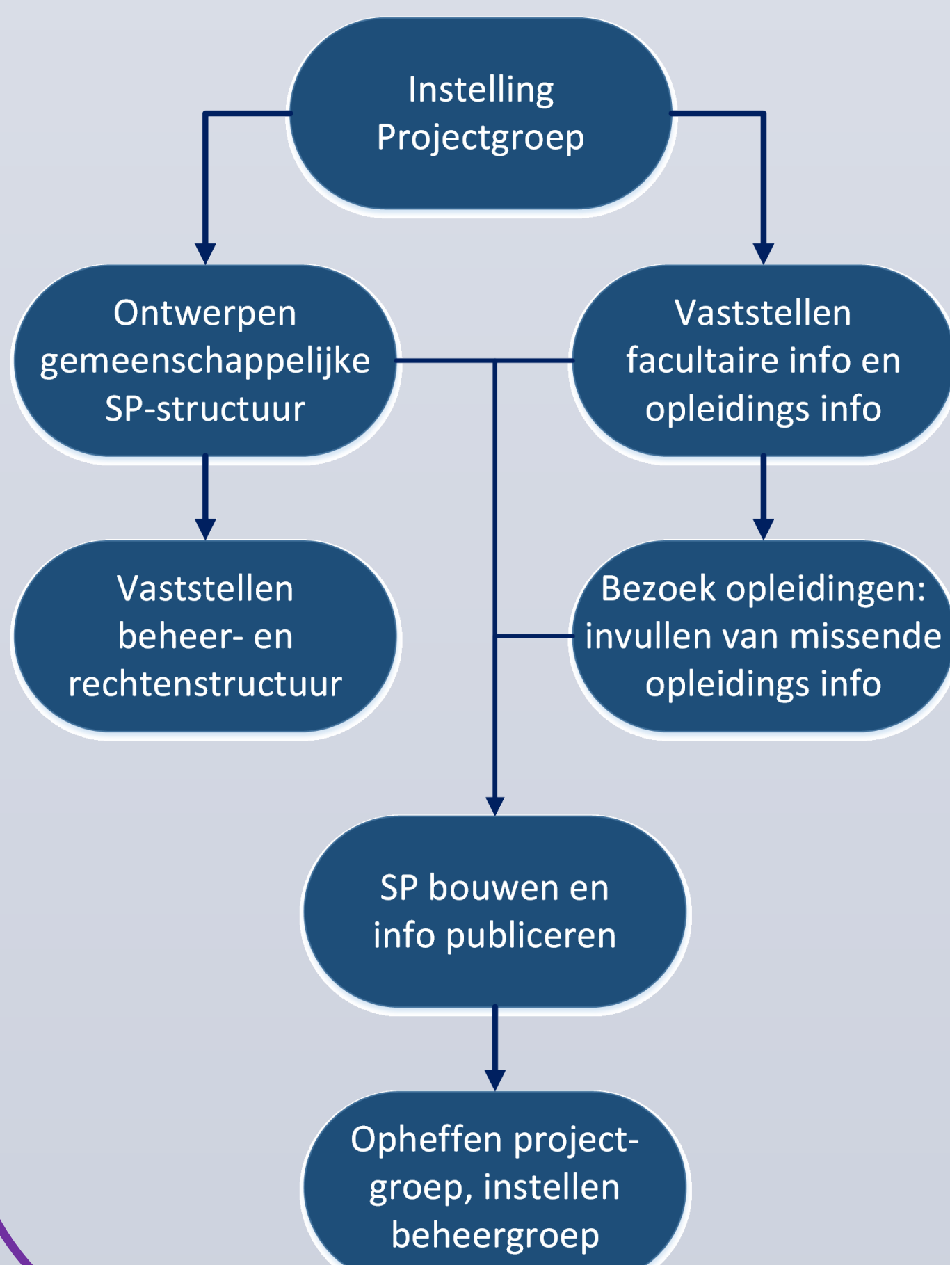
Figuur 2: Projectstappen

Het bouwen van de structuur, en het vullen van de SP met informatie, gebeurde continu tijdens de verschillende projectstappen. Na afronding werd een beheergroep ingesteld om de SP in de toekomst verder te onderhouden.